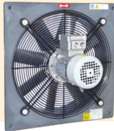
PLATE AXIAL FAN IN EXPLOSIVE ATMOSPHERE G OR D GROUP II CATEGORY 2 OR 3